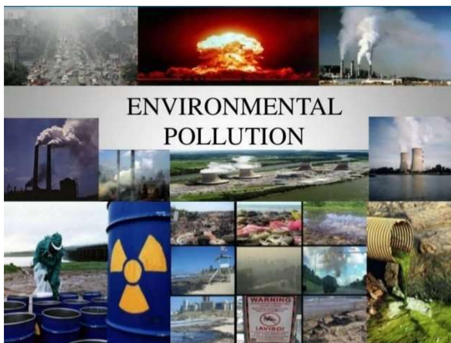
Slika 2.1.1. Environmental pollution – onečišćenje okoliša (Elders, 2023).

su kopnene vode, plitka mora, kao Baltičko i Jadransko more te velika gradska naselja i industrijske zone. Različite su otpadne tvari kojima se onečišćuje okoliš, a isto tako različiti je njihov utjecaj na živi svijet, čovjeka te na ekološka zbivanja u ekosustavima. Najstariji i danas najopsežniji oblik onečišćavanja jest unošenje organskih visokomolekularnih tvari u vodene ekosustave iz naselja (kućanske otpadne vode) i različitih industrijskih pogona, kao što su tvornice papira i celuloze, šećerane, kožare, klaonice, svinjogojske farme i sl. Na poseban način na živi svijet djeluju anorganske tvari, kao što su teški metali, kiseline i baze te soli nekih elemenata, koje su često otpadne tvari različitih industrijskih pogona, zatim biocidi, koji se primjenjuju u ratarstvu i šumarstvu, radioaktivne tvari, produkti izgaranja u industrijskim poduzećima, toplanama, stambenim zgradama i motornim vozilima (Poazić, 2004). Sva ta onečišćenja mogu izazvati efekt bioakumulacije u organizmima koji nastanjuju šire područje, a određene mjere se često poduzimaju tek kada nastupe nepovratne posljedice po zdravlje čovjeka (Papa Franjo, 2020). Slika 2.1.1. prikazuje brojne izvore onečišćenja okoliša.