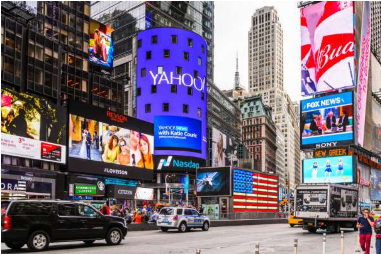
Slika 3.3.1. Reklame na Time Square-u (Safithri, 2023).

neminovno mora biti veća, tako i zbog povećanog onečišćenja zbog potrebe za zbrinjavanjem nastalog otpada.