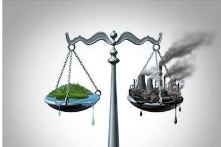
Slika 4.1. Okoliš ili ekonomija (Mitall, 2023).

Zanimljivo je da su neki promatrači čak i u devetnaestom stoljeću primijetili da komercijalna moć može biti jednako nemilosrdna kao i tiranska vladavina. Na primjer, Alfred Tennyson, pišući iz srca britanskog establišmenta u tom stoljeću, primijetio je kako su pretjerani zahtjevi merkantilizma čak i u njegovo vrijeme prisiljavali svijet na pravila ponašanja usmjerena isključivo na komercijalnu dobit. Vojni imperijalizam iz prošlosti sada je naslijedio ekonomski imperijalizam koji je na mnoge načine jednako moćan. U ovom okviru dominantna etika je maksimiziranje profita, a to znači maksimiziranje trgovine, proliferaciju proizvodnje, sve veću potrošnju zemaljskih resursa i zanemarivanje dugoročnih perspektiva (Weeramantry, 2009).