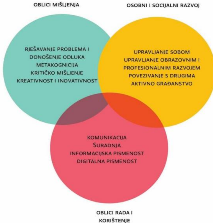
Slika 2. Generičke kompetencije [Ministarstvo znanosti i obrazovanja,2018.]

Oblici mišljenja je jedna od cjelina generičkih kompetencija koja označava različite segmente poput rješavanja problema i donošenja vlastitih odluka, metakognicije koja označava aktivno preispitivanje određenih kognitivnih zadataka kojeg pojedinac izvodi u službi određenog postavljenog cilja. Također, ova cjelina obuhvaća i kritičko mišljenje te kreativnost i inovativnost kao važne segmente razvoja pojedinca. Kritičko mišljenje omogućuje pojedincu sposobnost analiziranja, vrednovanja i sintetiziranja informacija na način u kojem pojedinac može donijeti odluke koje su temeljene na znanstvenim i provjerenim informacijama. Kritičko mišljenje potiče pojedinca da postavlja pitanja, traži argumente i razumije implikacije određenih postupaka. Kreativnost i inovativnost označavaju jedne od ključnih faktora u tehnici i tehnologiji jer omogućavaju stvaranje novih ideja te dodavanje novih funkcija i ideja postojećim uređajima i tehnikama. Cjelina osobni i socijalni razvoj obuhvaća upravljanje sobom tj. vlastitim mislima, postupcima, razvoju i čitavom djelovanju. Zatim, slijedi cjelina upravljanje obrazovnim i profesionalnim razvojem. Ova cjelina generičkih kompetencija obuhvaća upravljanje sobom, upravljanje obrazovnim i profesionalnim razvojem, povezivanje s drugima te aktivno građanstvo. Upravo ova cjelina omogućava učenicima osigurava