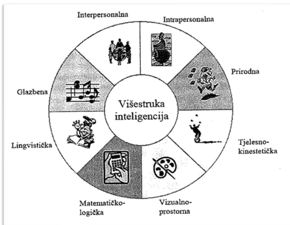
Slika 3. Grafički prikaz modela višestrukih inteligencija [Bognar, 2009.]

Tablica 1. prikazuje model Gardnerovog modela višestruke inteligencije.