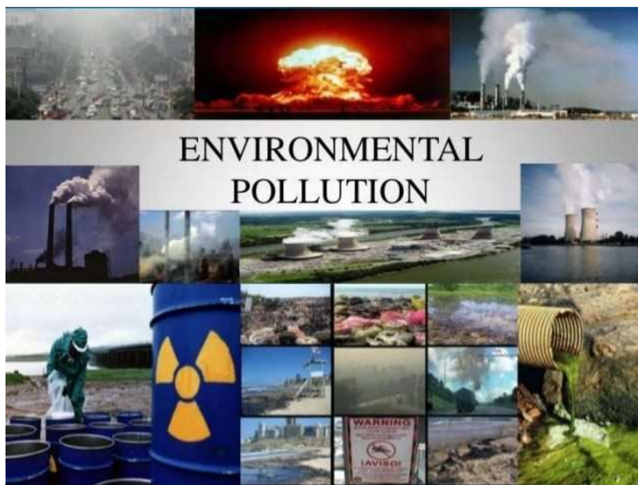
Slika 2.1.1. Environmental pollution – onečišćenje okoliša (Elders, 2023).

su kopnene vode, plitka mora, kao Baltičko i Jadransko more te velika gradska naselja i industrijske zone. Različite su otpadne tvari kojima se onečišćuje okoliš, a isto tako različiti je njihov utjecaj na živi svijet, čovjeka te na ekološka zbivanja u ekosustavima. Najstariji i danas najopsežniji oblik onečišćavanja jest unošenje organskih visokomolekularnih tvari u vodene ekosustave iz naselja (kućanske otpadne vode) i različitih industrijskih pogona, kao što su tvornice papira i celuloze, šećerane, kožare, klaonice, svinjogojske farme i sl. Na poseban način na živi svijet djeluju anorganske tvari, kao što su teški metali, kiseline i baze te soli nekih elemenata, koje su često otpadne tvari različitih industrijskih pogona, zatim biocidi, koji se primjenjuju u ratarstvu i šumarstvu, radioaktivne tvari, produkti izgaranja u industrijskim poduzećima, toplanama, stambenim zgradama i motornim vozilima (Poazić, 2004). Sva ta onečišćenja mogu izazvati efekt bioakumulacije u organizmima koji nastanjuju šire područje, a određene mjere se često poduzimaju tek kada nastupe nepovratne posljedice po zdravlje čovjeka (Papa Franjo, 2020). Slika 2.1.1. prikazuje brojne izvore onečišćenja okoliša.