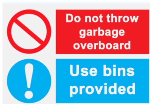
Slika 1. Zabranjeno bacanje otpada [11].

MARPOL Aneks 5 zabranjuje ispuštanje svih vrsta otpada u more s brodova, osim u slučajevima koji su izričito dopušteni u Aneksu (kao što su ostatci hrane, ostatci tereta, sredstva/aditivi za čišćenje koji nisu štetni za morski okoliš). Time, a što je prikazano na slici 1, Aneks 5 propisuje pravilno odlaganje otpada u spremnike predviđene za to [11].