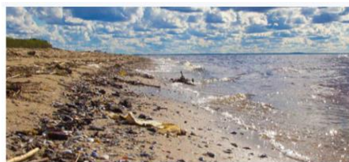
Slika 2. Morski otpad na žalu [11].

Morski otpad predstavlja velik problem u našim oceanima i na obalama kao što je vidljivo iz slike 4. Neki znanstvenici upozoravaju da će do 2050. godine količina plastike u oceanima premašiti količinu ribe. No, IMO i drugi poduzimaju mjere za rješavanje problema, uključujući reguliranje ispuštanja otpada s brodova i potporu istraživačkom radu [1].