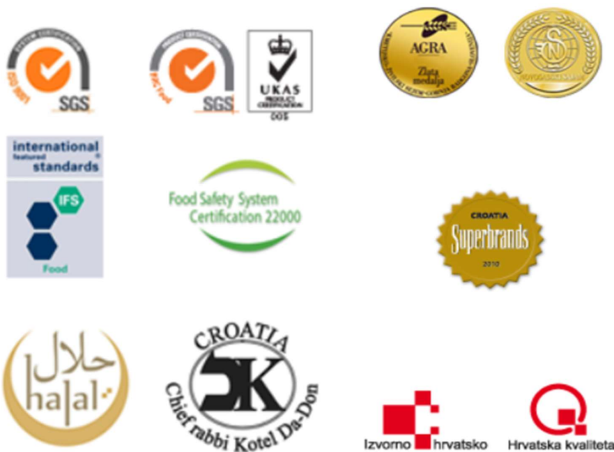
Slika 2. Certifikati poduzeća „Vindija“ d.d. Varaždin