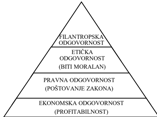
Slika 1. Piramida društveno odgovornog poslovanja